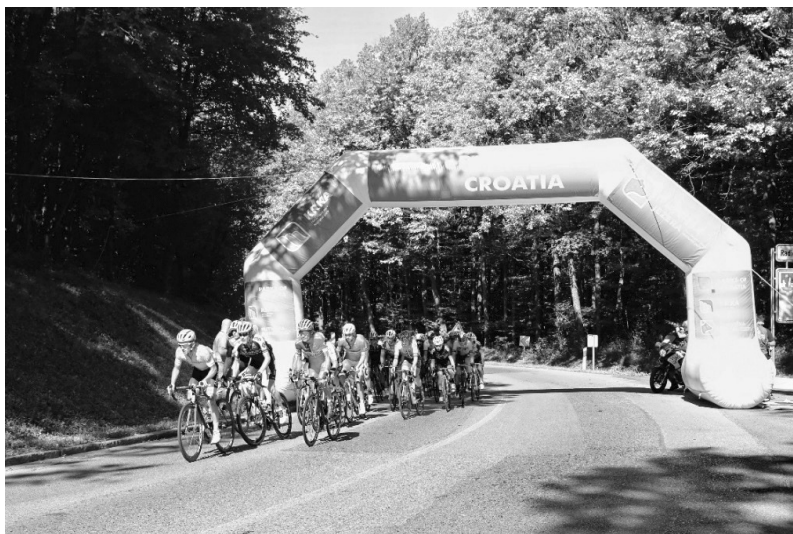
Slika 2. Prolazna vrata brdskog cilja