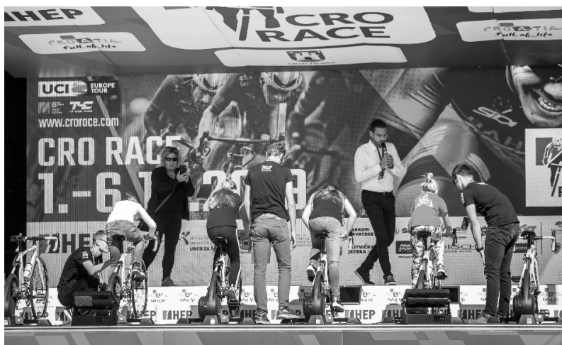
Slika 3. KIDS CRO Race

Bitno je spomenuti da je 2019. godine prvi put organizirana i KIDS CRO Race. Tako su u Osijeku, Lipiku, Zadru, Makarskoj, Crikvenici, Rijeci i Zagrebu bili postavljeni trenažeri smart home treneri koji se međusobno umrežuju te na TV ekranu reproduciraju animaciju biciklističke utrke, pretvarajući svaki trenažer u animiranu figuru. Svaki trenažer ima ubačen isti protokol opterećenja te djeca istovremeno startaju u virtualnoj biciklističkoj utrci koja se prikazuje na ekranu.