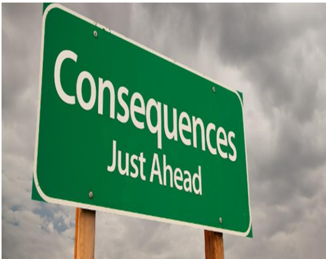
Slika 3. Naslov slike